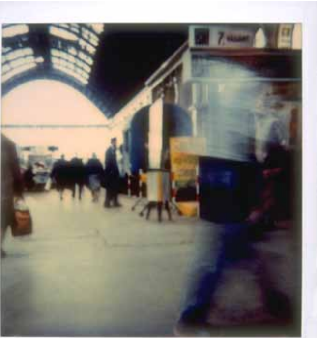
Orient Express Polaroid N° 2 du retour Budapest-Paris