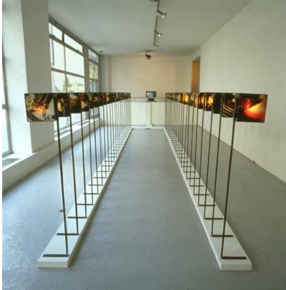
Orient Express - Exposition à la Galerie Donguy, Paris - 1991 (format 10 x 2,5 mètres)

Des tiges en fer plat permettent de visser chacun des 50 caissons lumineux. Sous les coffrages les fils électriques alimentent chaque caisson séparément. Un système électronique allume successivement chaque caisson.