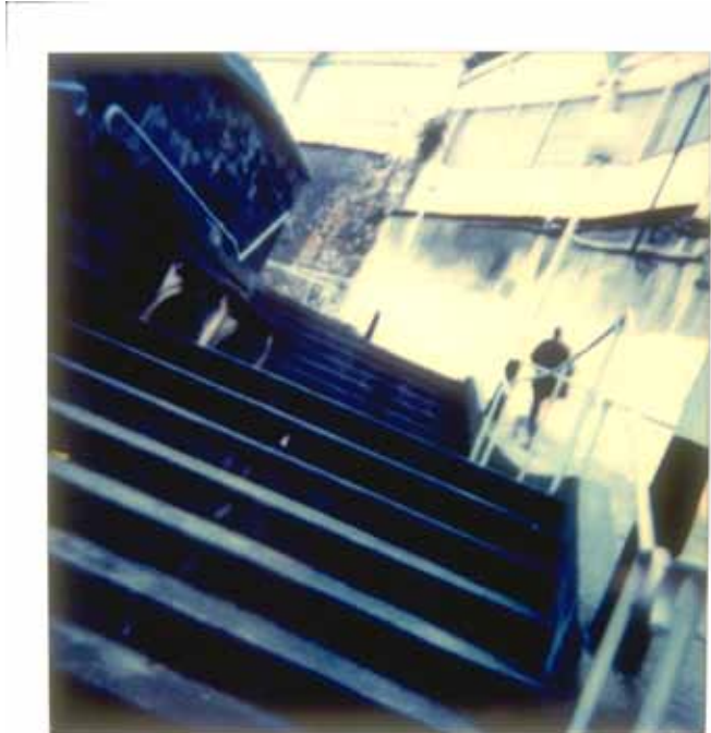
Orient Express Polaroid N° 24 du retour Budapest-Paris