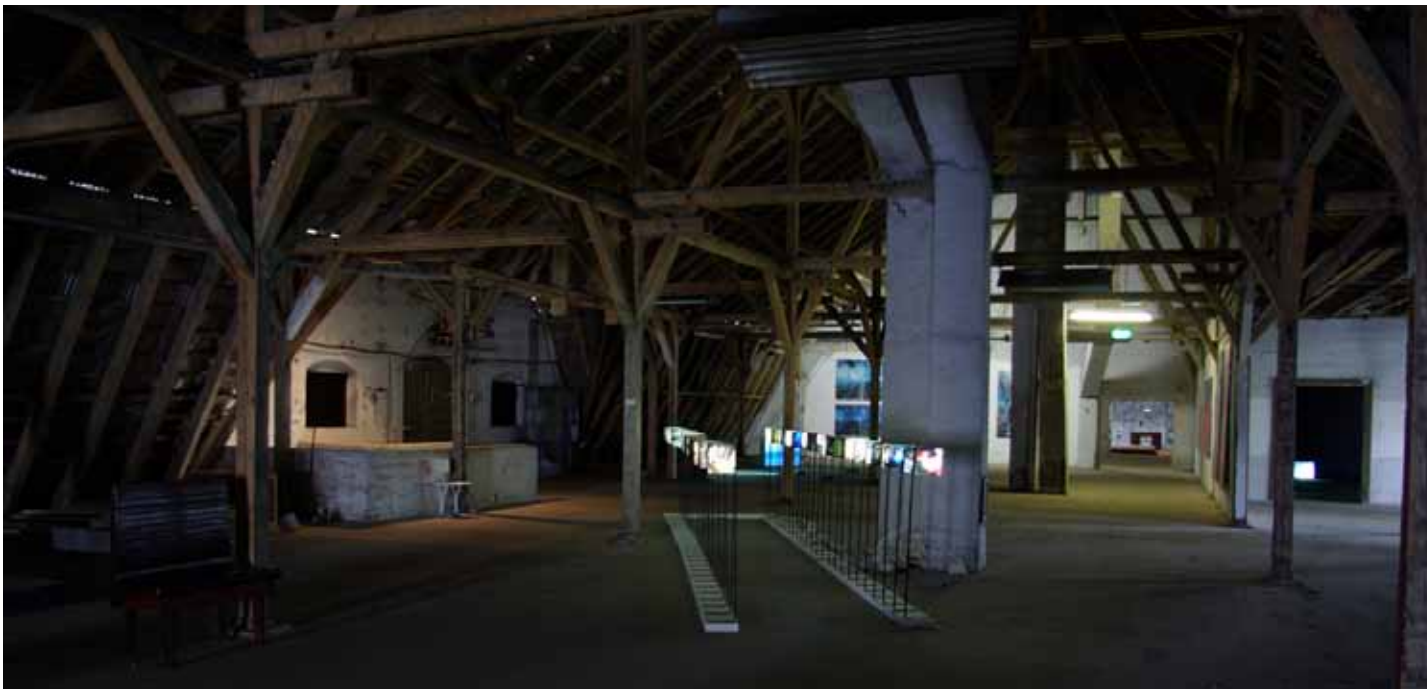
ORIENT EXPRESS à OSTRALE exposition Internationale DRESDE août 2010