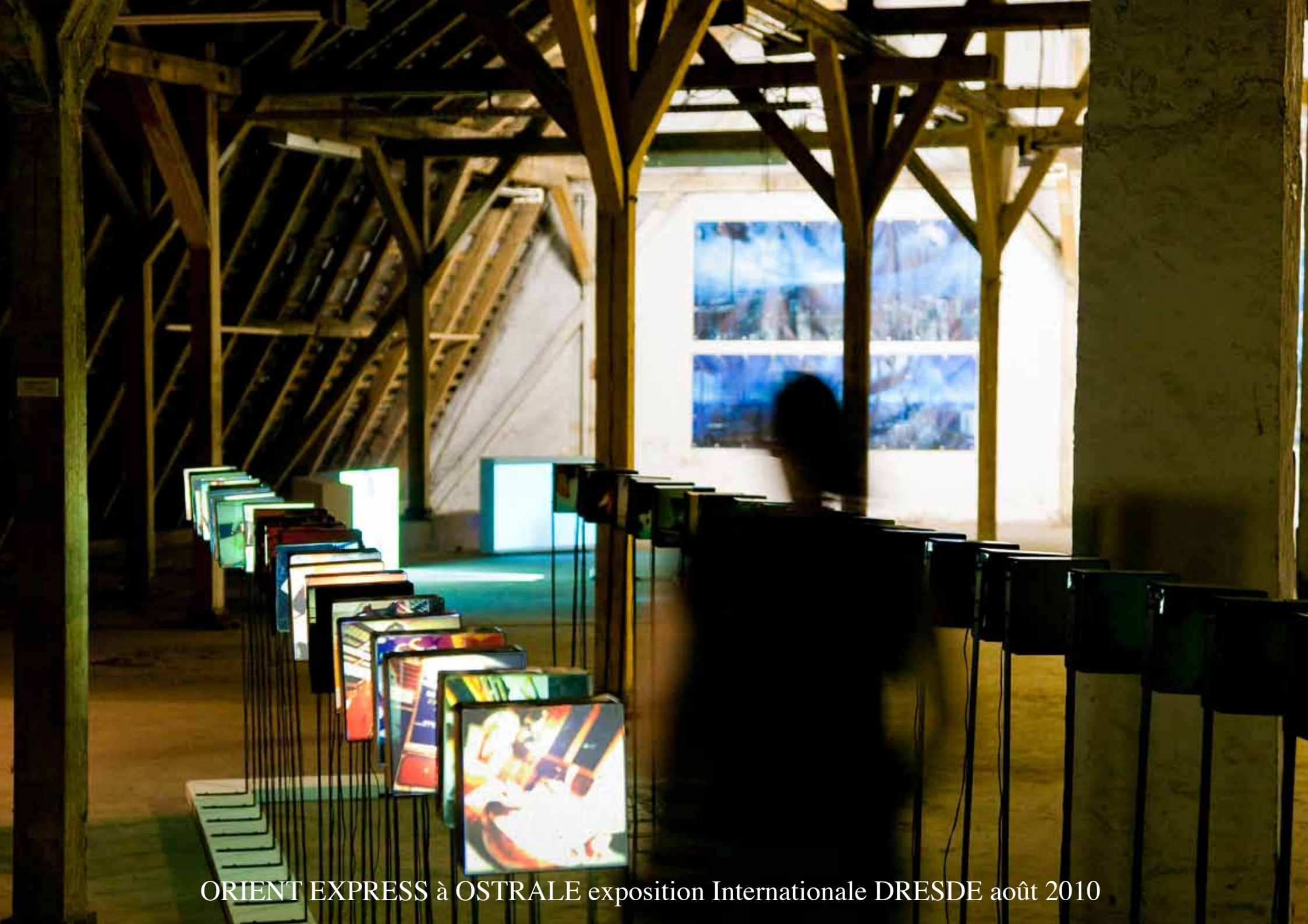
ORIENT EXPRESS à OISTRALE exposition Internationale DRESDE août 2010