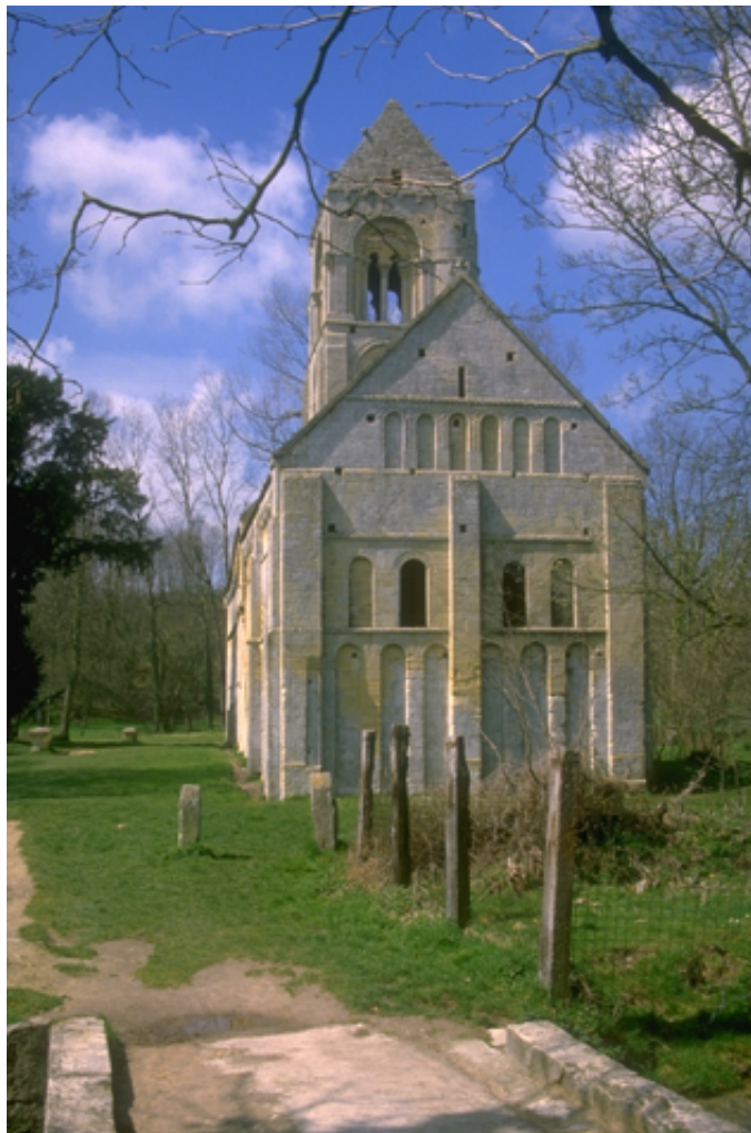
De la vieille église de Thaon...